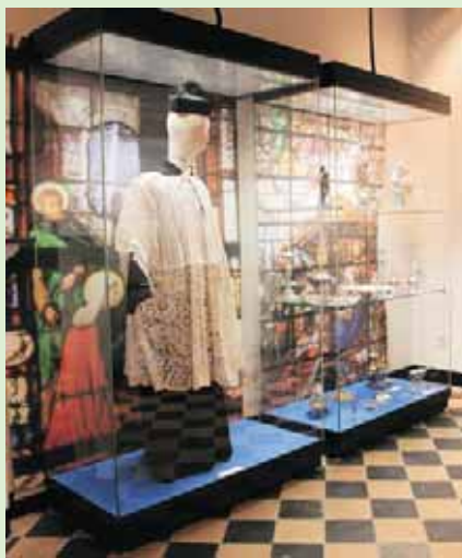
Koning Boudewijnstichting, aan het Begijnhofmuseum geschonken 19 .